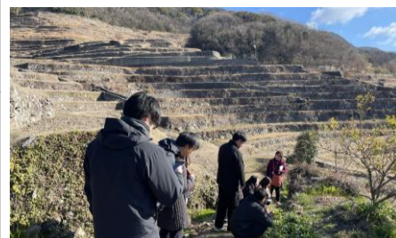
視察の様子（中山千枚田）