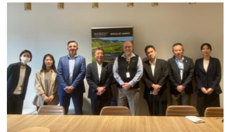
セールスコール後の写真