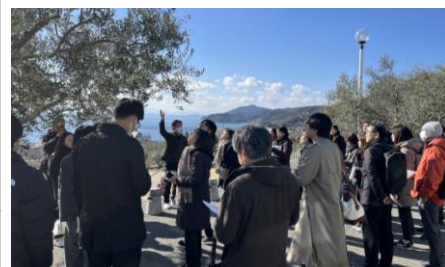
視察の様子（道の駅小豆島オリーブ公園）