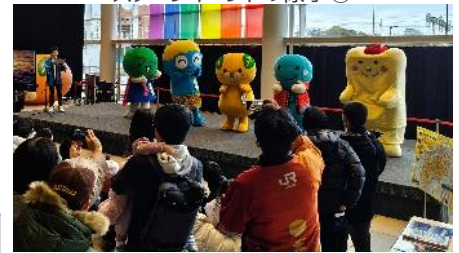
ステージイベントの様子②（ゆるキャラ）