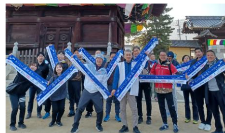
出発前の集合写真