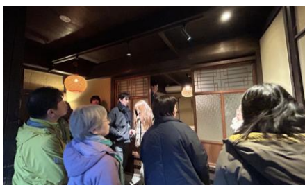
視察の様子(「NIPPONIA仁尾 水鏡の町」)