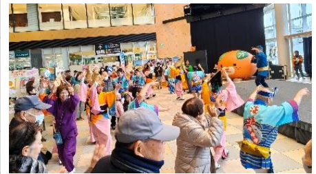
ステージイベントの様子③（阿波おどり）