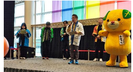
ステージイベントの様子①

引き続き、関西圏における四国の認知度向上と誘客促進に向け、関係各所と連携しながら取り組んでまいります。