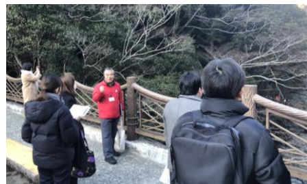
視察の様子(祖谷のかずら橋)