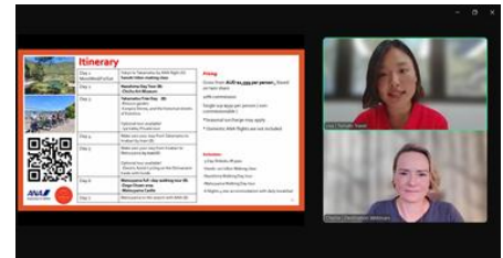
ウェビナー登壇者 (Tomato Travel社)