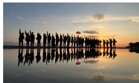
視察の様子(父母ヶ浜)