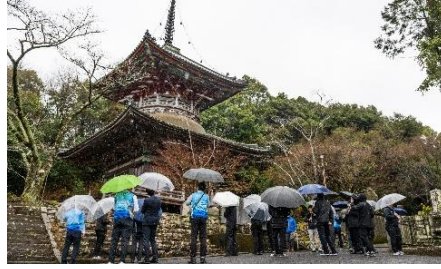
視察の様子（第8番札所熊谷寺）