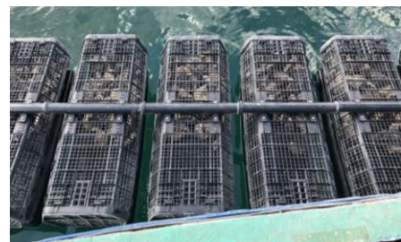
シングルシード方式のカゴ