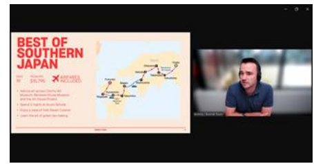
ウェビナー登壇者 (Bunnik Tours社)