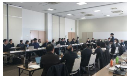
講演・意見交換の様子