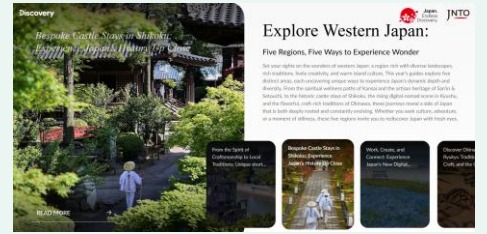
【遷移先： ディスカバリーチャンネル記事 】