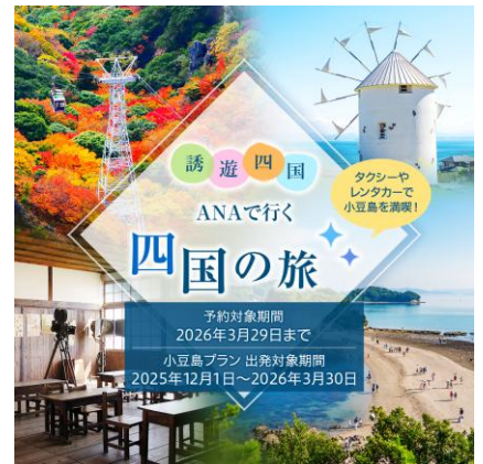
ANA誘遊四国キャンペーン 「小豆島満喫プラン」案内パネル