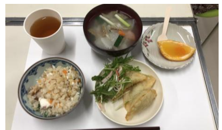
食のコンテンツ体験会で提供された郷土料理