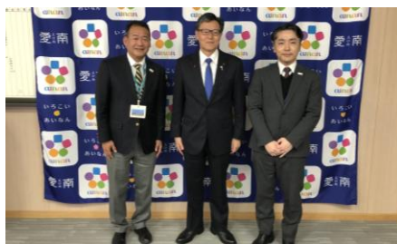
愛南町・中村町長訪問の様子