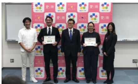
認定式での記念撮影の様子