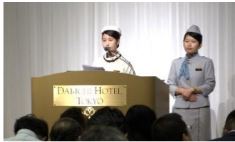
プレゼンテーション(東京)