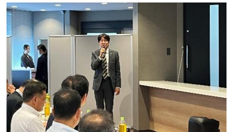
ジャルパックパック 平井社長の挨拶