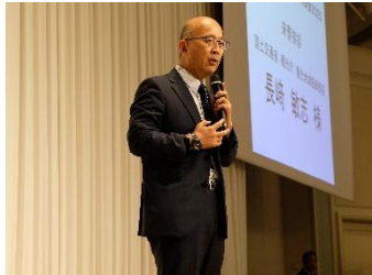
挨拶: 長崎 観光庁観光地域振興部長