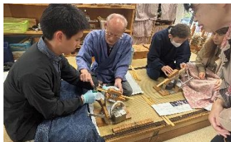
丸亀うちわ体験(香川)