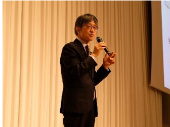
挨拶: 蒲生(独) 国際観光振興機構理事長