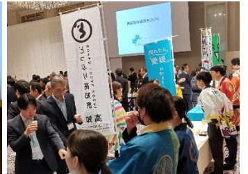
地酒など試飲の様子