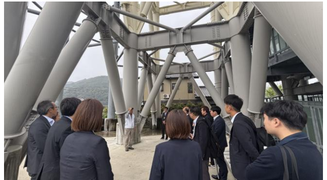
佐賀地区津波避難タワー視察の様子