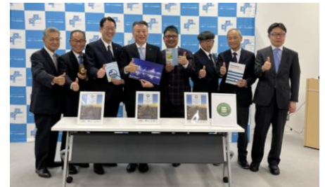
記者発表後の記念撮影の様子