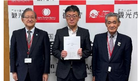
要望書提出の様子