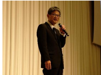
挨拶: 河野 国土交通省海事局次長