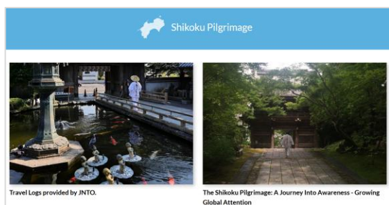
当機構の 四国遍路ページ