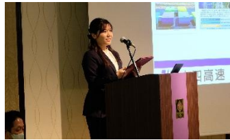
プレゼンテーション(大阪)