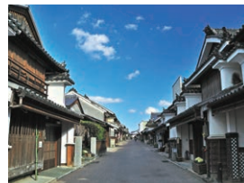
興光二層樓建築街景