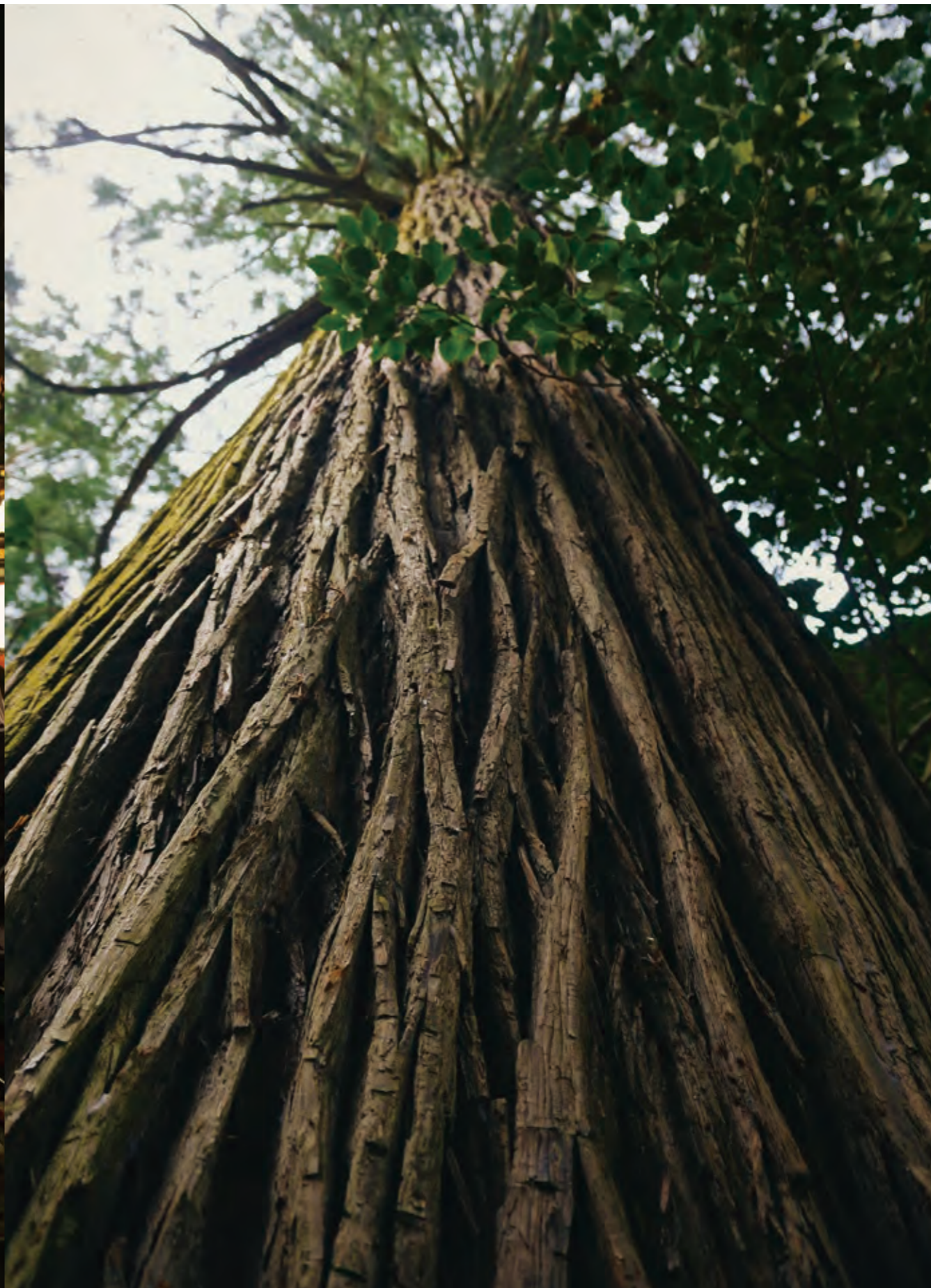
在巡遊四國的旅途中，希望您能找到一個好的能量，並帶回家去。瑟瑟搖擺的樹枝，那經過漫長歲月積蓄力量的神木也是其中之一。從巨大的樹幹散發出來的溫馨，將撫平您心靈的褶皺。