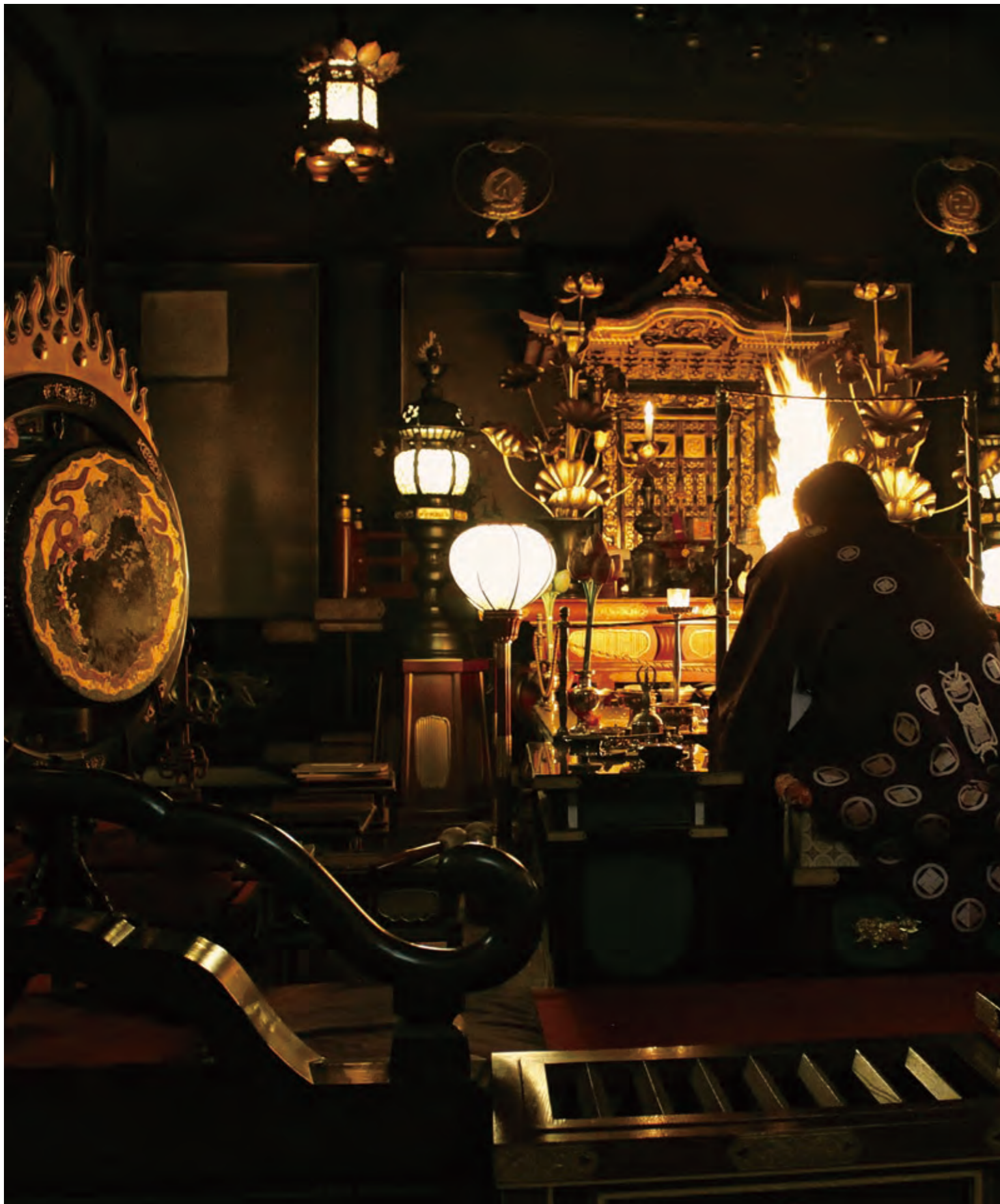
在四國傳承的佛教教誨與有無信仰無關，為眾多的到訪者釋解心靈的困惑和痛苦。僧侶們的護摩焚也是賜福人類之一。散佈在四國的眾多靈場中，一定可以找到與您共鳴之地。