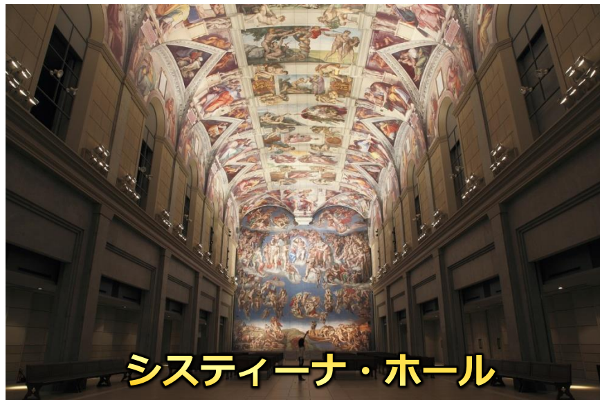
システィーナ・ホール

2020年8月、世界最大の旅行プラットフォーム「トリップアドバイザー」で「旅好きが選ぶ！日本人に人気の美術館ランキング 2020」で、大塚国際美術館が2位に選ばれました。