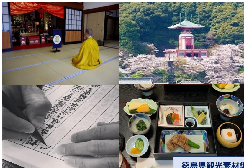
徳島県観光素材集 P35・No.212