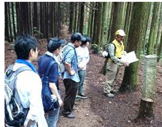
四国最古の遍路道 かも道トレッキング