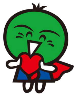
徳島県公式キャラクター すだちくん