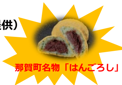
那賀町名物「はんごろし」