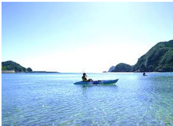
竹ヶ島海域公園 シーカヤック&SUP