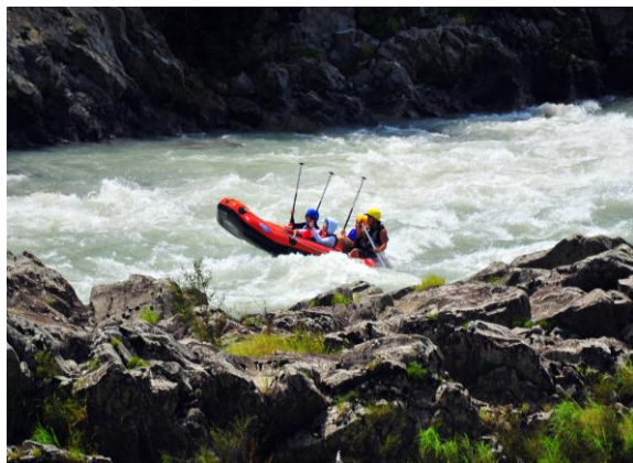
鷺敷ライン カヌー&ラフティング川下り