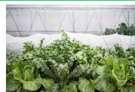
▲土佐伝統野菜の畑