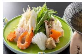
▲土佐の伝統野菜を使用した夕食

2024年11月15日（金）に開通100周年を迎えるにあたり、各地域における鉄道利用促進や賑わいづくり、利用者及び沿線市民の皆様との交流拡大に寄与する事を目的に、関係自治体と協働し、記念イベント等を実施します。