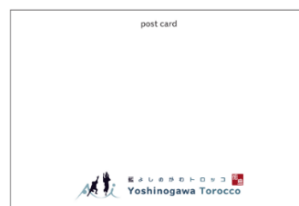
ポストカードイメージ (藍よしのがわトロッコオリジナル)