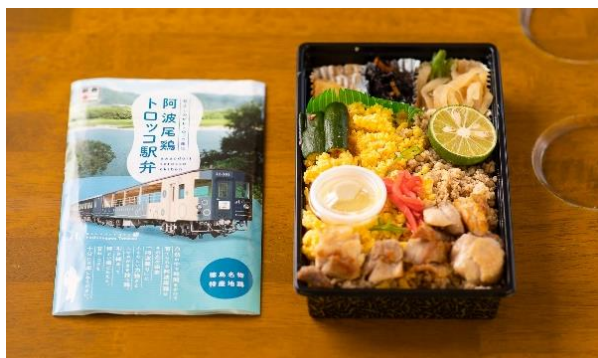
阿波尾鶏トロッコ駅弁 1,300円(税込) 栗尾商店(徳島県美馬郡つるぎ町)