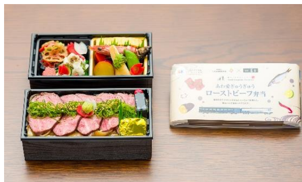
あわ愛ぎゅうぎゅう ローストビーフ弁当 3,200円(税込) 日本料理 味匠 藤本(徳島県三好市東みよし町)