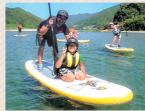
仁淀川SUP立槳衝浪體驗